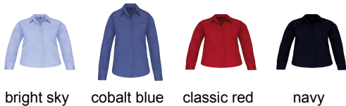
bright sky cobalt blue classic red navy